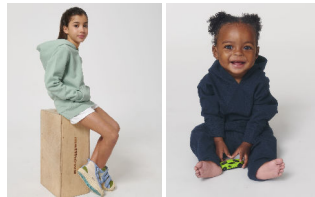
Mini Cruiser Baby Cruiser